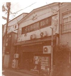
セツ寺共同スタジオ

この企画が始まって、いろんな人に声を掛けました。中日新聞に記事が載った時は、多くの方から声を掛けていただきました。コロナという情勢のなか、関わるのが難しい人もいますが、セツ寺共同スタジオの50周年に恥じない企画にしますので、ぜひ本公演を観にきて、50周年を一緒に祝ってもらえればうれしい限りです。