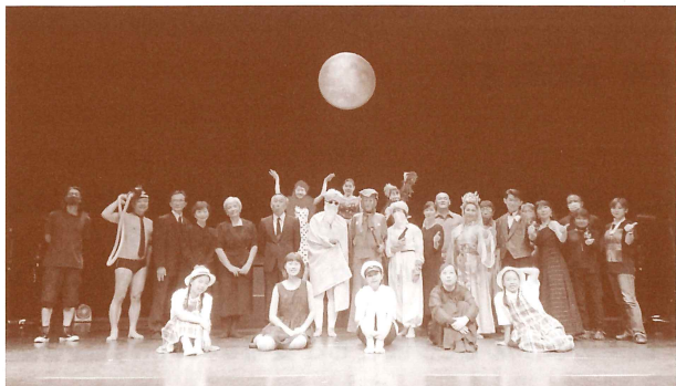
劇団天白月夜「相思」 2020年9月 天白文化小劇場にて

2020年6月、顧問を務める劇団天白月夜の定期公演が危ぶまれるという事態になった。劇団天白月夜は演劇講座受講生から生まれた市民劇団である。誰でも入団できるが、サークル活動のようなつもりではない。常に社会に目を向け、新しいことに挑戦する志高い劇団であると思っている。その劇団の危機とあって一念発起、旧知の天野天街氏に演出を頼