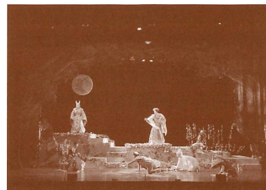
劇団天白月夜 『月と森のソネット2021』 2021年10月 天白文化小劇場にて

演劇は常に時代と共にある。精一杯足掻いて、この時代ならではの作品を創り続けたい。